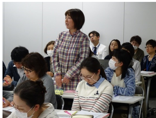
・総勢43名の職員が受講