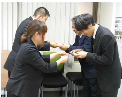
・お互いに確認しながらの名刺交換！