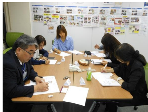
・身だしなみについてグループワーク