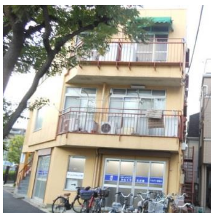
リニューアルオープン！

引き続きこれまで以上に品質を向上させ、皆様に喜んで頂けるサービスを目指し、地域貢献できるよう努めて参ります。