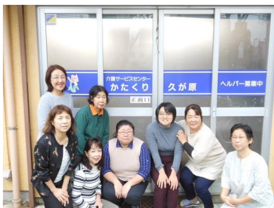
ケアマネジャー 5 名 サービス提供責任者 3 名 常勤ヘルパー 1 名